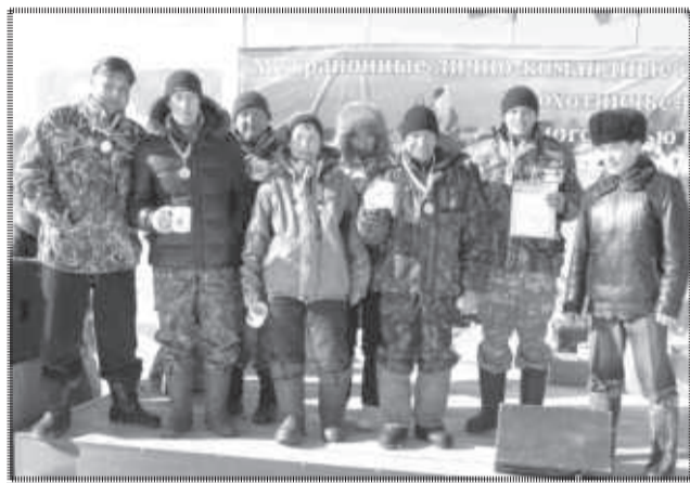
Команда-победительница, Усть-Удинский район.

В Балаганском районе сезон подледного лова и охоты традиционно завершается межрайонными соревнованиями по охотничье-рыболовному многоборью. В этом году XI межрайонные соревнования состоялись 11 марта, на привычном месте - льду залива Кальвария Братского водохранилища.