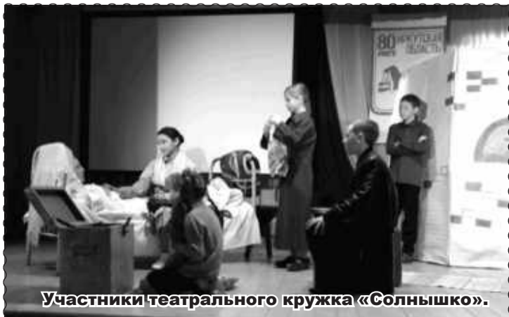
Участники театрального кружка «Солнышко».