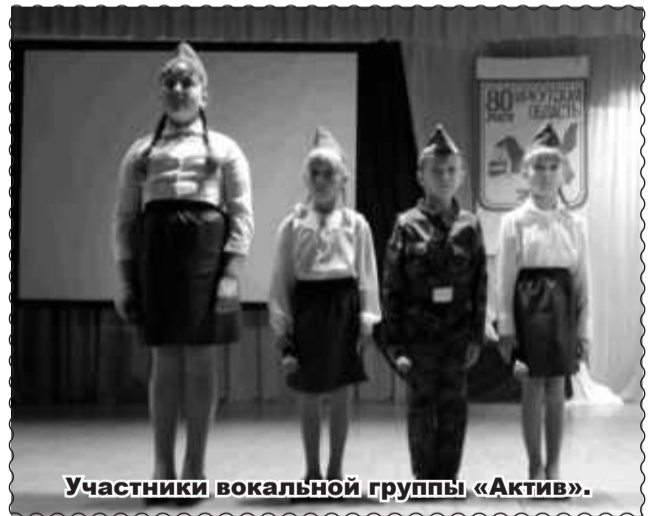
Участники вокальной группы «Актив».