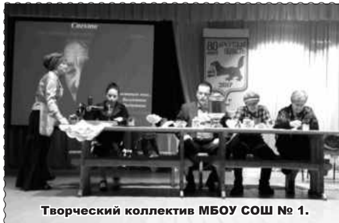
Творческий коллектив МБОУ СОШ № 1.