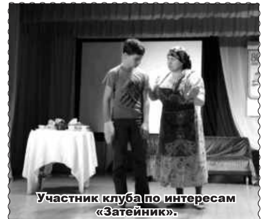
Участник клуба по интересам «Затейник».