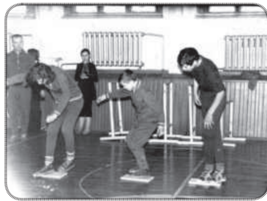
Занятия физкультурой в БСШ.