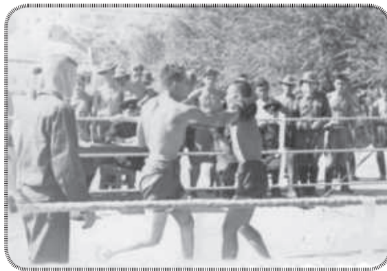
Показательные бои в честь дня Советской Армии в-ч 20040 г.Туркестан 1958 г.