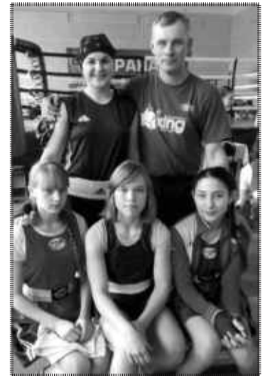
Первенство Иркутской области, г.Ангарск.