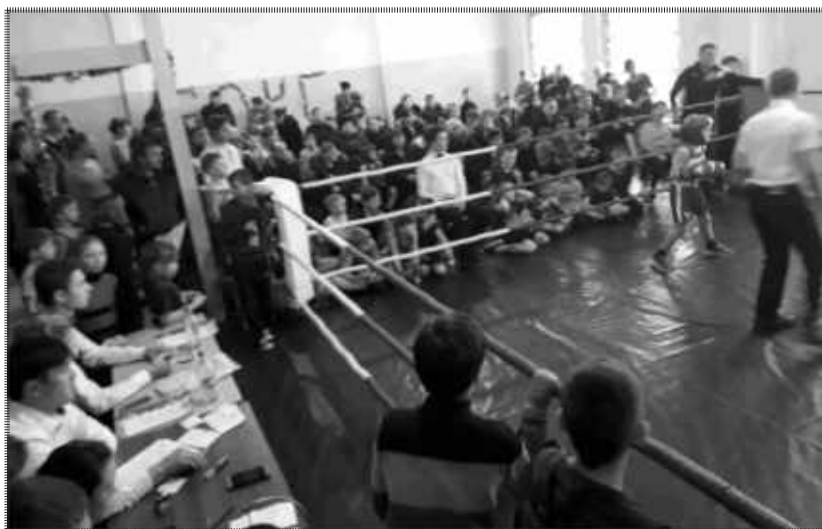
Начало поединков новогоднего турнира, п.Балаганск.