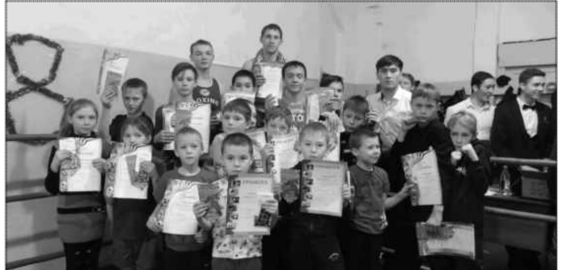
Спортсмены Балаганской секции бокса.