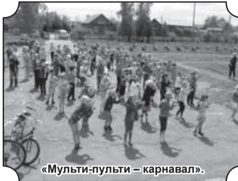
«Мульти-пульти – карнавал».