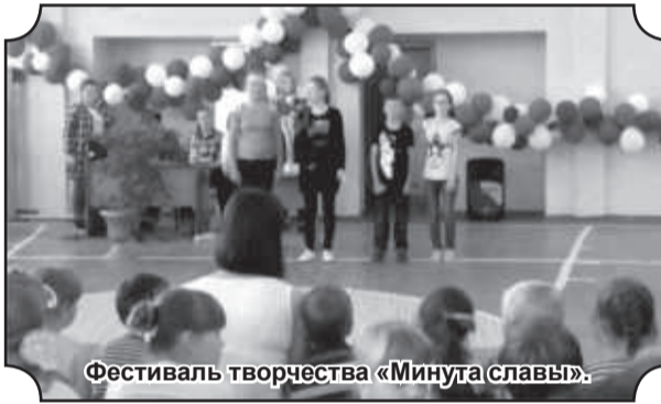
Фестиваль творчества «Минута славы».