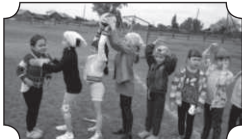
Дружеская встреча МБОУ Балаганская СОШ №1 и МБОУ Балаганская СОШ №2.