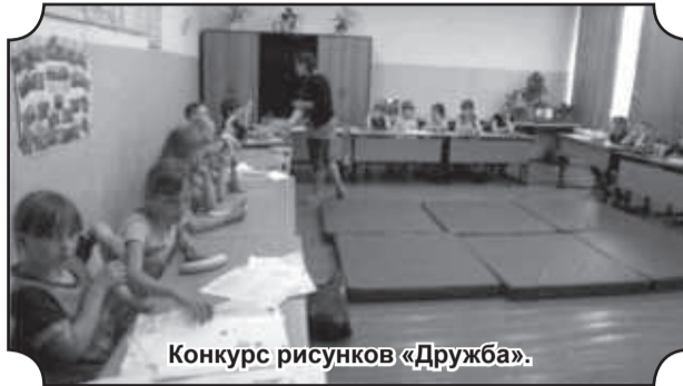
Конкурс рисунков «Дружба».