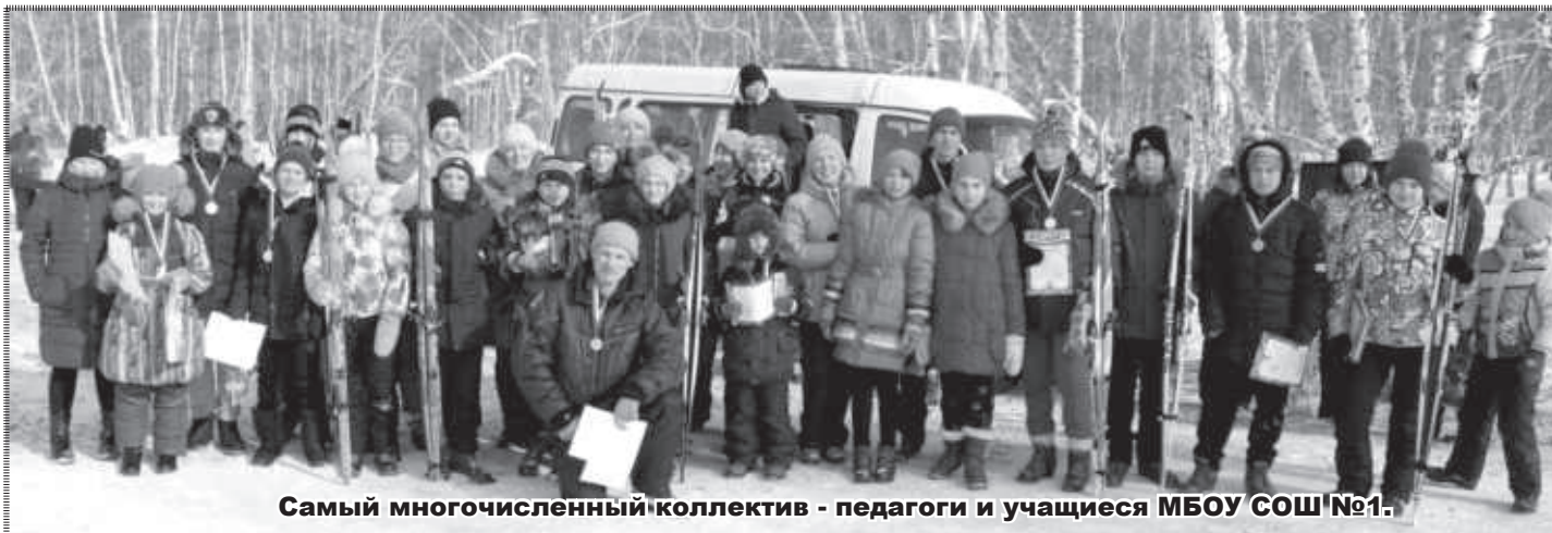
Самый многочисленный коллектив - педагоги и учащиеся МБОУ СОШ №1.