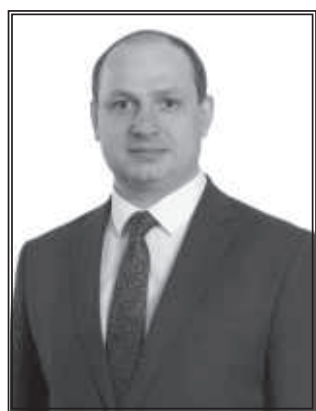
Александр Дубровин, депутат Законодательного Собрания Иркутской области

Северные города и районы Иркутской области – часть нашей огромной и великой страны. Свой нынешний облик они приобрели благодаря усилиям первопроходцев и строителей из разных регионов и республик бывшего СССР. Родина вложила немалые ресурсы в освоение сурового сибирского края. И