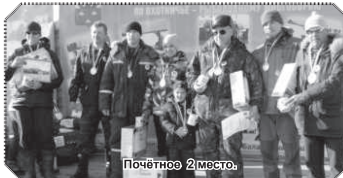
Почётное 2 место.