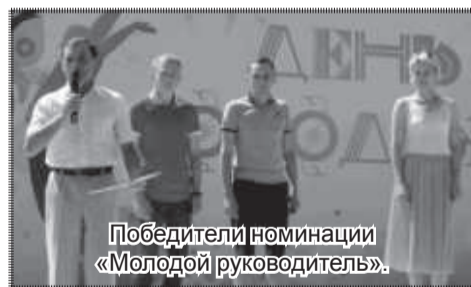
Победители номинации «Молодой руководитель».