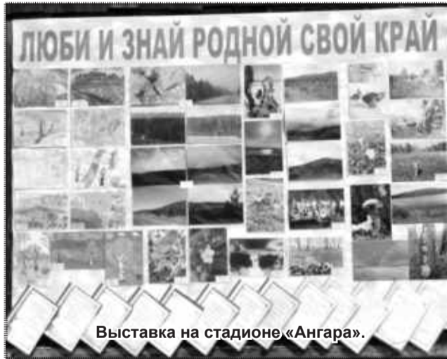
Выставка на стадионе «Ангара».