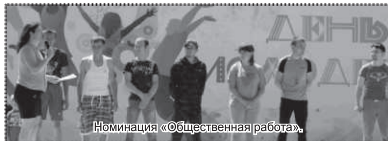
Номинация «Общественная работа».