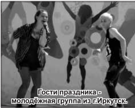
Гости праздника - молодёжная группа из г.Иркутск.

*к-рор, аббревиатура от английского Kogean port - музыкальный жанр, возникший в Южной Корее и вобравший в себя элементы западного электропопа, хип-хопа, танцевальной музыки и современного ритм-н-блюз.