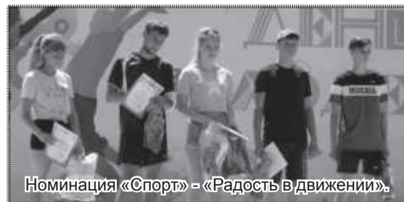
Номинация «Спорт» - «Радость в движении».

за 30 лет – возраста, до которого, согласно официальной градации, граждане России считаются молодыми. Ведь подобные праздники – прекрасный повод встретиться с друзьями, знакомыми, узнать новости политической, культурной, спортивной жизни района, наконец, просто пообщаться.