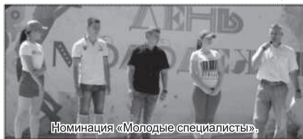
Номинация «Молодые специалисты».