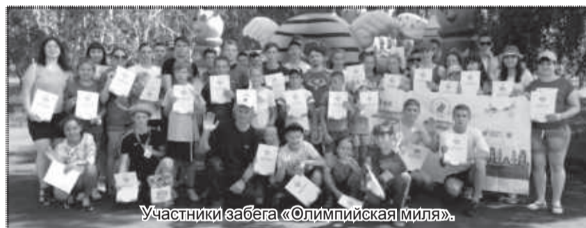
Участники забега «Олимпийская миля».