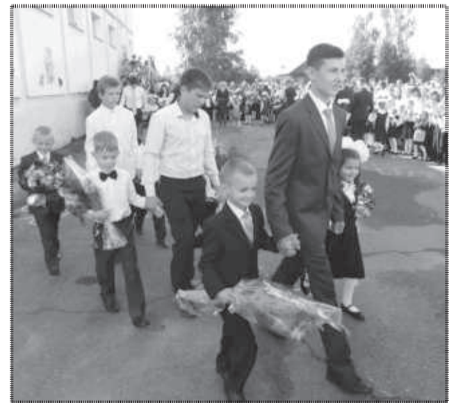
Торжественная линейка в БСОШ №2, проведенная на новом, более просторном месте.

взволнованы первоклассники и выпускники, ведь именно этот день для малышей самый первый, для старшеклассников же - это последняя школьная сентябрьская линейка. С ответным словом выступают первоклашки, от них эстафету подхватывают старшеклассники, которые от слов пожеланий переходят к делу и вручают им такие нужные школьные подарки от