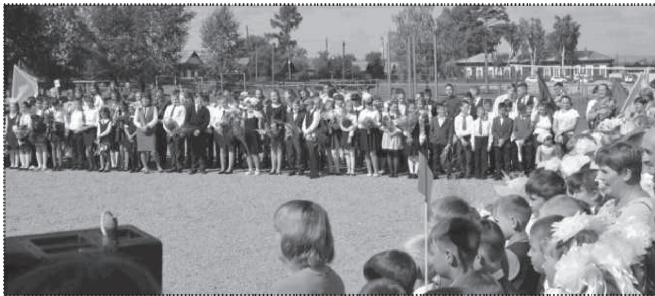
Выпускники БСОШ №1 провожают малышей в их первые в жизни классы.

положенных в сельской местности. В рамках этой программы были проведены капитальные ремонты спортивных залов в двух школах района. Так, например, ремонт в спортзале МБОУ Биритская СОШ, направленный на утепление помещения, включил в себя такие мероприятия как замена кровли и утепление крыши. Стены помещения укреплены, выровнены, и уже в конце августа их утеплили и обшили сайдингом. Так же проведено устройство отмостки, а все окна и двери в зале заменены. На капремонт спортзала Ташлыкловской начальной общеобразовательной школы (филиал МБОУ